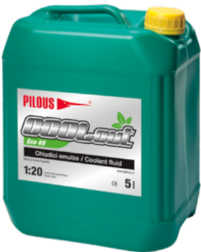
COOLcut Eco 65

Neben der Verwendung an Bandsägen ist sie für Bearbeitungsvorgänge sowohl an konventionellen Bearbeitungsmaschinen, als auch an NC-/CNC-Bearbeitungszentren vorgesehen.