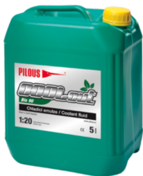
COOLcut Bio 90