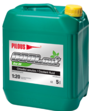
COOLcut Eco 65